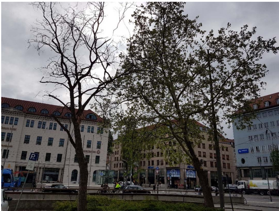
Abbildung 1: 2 Platanen südl. des Schwammerls am Bahnhofsvorplatz