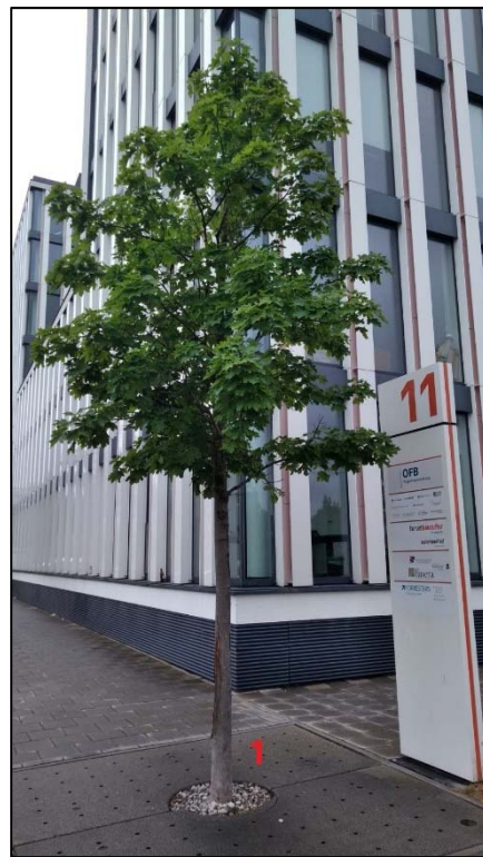
Abbildung 4: 2 betroffene Bäume am RS 3