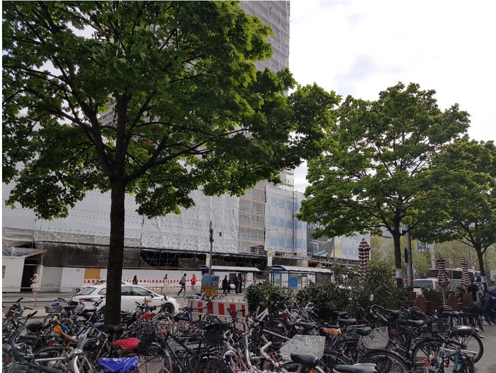
Abbildung 3: 2 Ahorne in der Arnulfstraße, nördl. Bahnhofsvorplatz